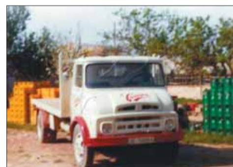
Imatges del treball diari a l'empresa, del grup de treballadors en el dinar de celebració del 40è aniversari i, a baix a la dreta, dels antics vehicles de Punset.